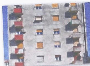
Prilaz Vala 10, LABIN