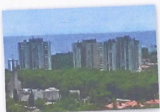
Krležina 35, PULA