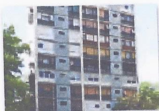
Trnsko 24, ZAGREB