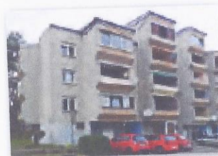
Baščinska 37, KARLOVAC