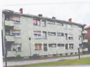
Zrinsko Frankopanska 4, ČAKOVEC