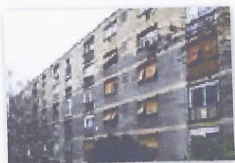
Lomnička 22, 22a, 22b, ZAGREB