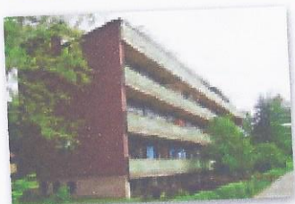
Kolodvorska 1, VARAŽDIN