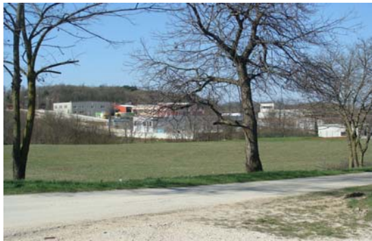
Industrijska zona Ciburi

U novoformiranoj poslovnoj zoni Podberam dovršen je objekt trgovačkog društva „Klanjac“ s 9 zaposlenih, dok se dovršetak objekta trgovačkog društva „Specijal“ očekuje u 2010. godini.