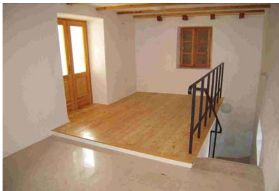
Kuća za pisce

Dovršeni su radovi na zgradi „Kuće za pisce – hiže od besid“ (objekt je svečano otvoren u prigodi zaključenje Mjeseca knjige, 15. studenog 2009., kada je potpisan i Ugovor o načinu sufinanciranja, korištenja i održavanja objekta).