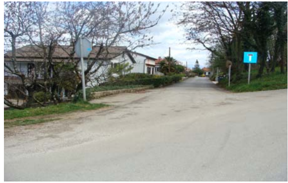
ulica Mate Balota

2.2.2. uređenje javnih površina: dovršenje okoliša gradske tržnice -sada Trg Kristijana Ladavca (opločenje – asfaltiranje javne površine te postavljanje javne rasvjete); uređenje pristupa u dijelu Kastavske ulice do stambenog objekta; izgradnja nogostupa u naselju Stancija Pataj; uređenje izlaza na glavnu cestu u ulici Vranica; rušenje derutne građevine u ulici Dallapiccola.