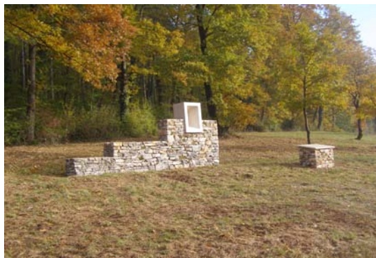
spomen obilježje prve oružane akcije Gortanovaca

U suradnji s partnerima iz Italije pripremljeni su i kandidirani projekti „Archeos“ i „Putovima Montecuccolia“ na natječaj Europskih fondova.