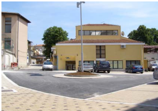
Trg Kristijana Ladavca

2.2.2. uređenje javnih površina: dovršenje okoliša gradske tržnice -sada Trg Kristijana Ladavca (opločenje – asfaltiranje javne površine te postavljanje javne rasvjete); uređenje pristupa u dijelu Kastavske ulice do stambenog objekta; izgradnja nogostupa u naselju Stancija Pataj; uređenje izlaza na glavnu cestu u ulici Vranica; rušenje derutne građevine u ulici Dallapiccola.