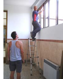
OŠ V. Nazora Pazin

Nastavljene su pripreme radnje za dogradnju Gimnazije i strukovne škole Jurja Dobrile i izgradnju školsko gradske sportske dvorane. Izrađeno je Idejno arhitektonsko i urbanističko rješenje projekta i započete su aktivnosti na rješavanju pitanja otkupa zemljišta potrebnog za izgradnju. Izrađen je i Idejni projekt izgradnje Osnovne škole na Starom Pazinu usklađen s Državnim pedagoškim standardom i upućen Upravi za financije Ministarstva znanosti, obrazovanja i športa na očitovanje.