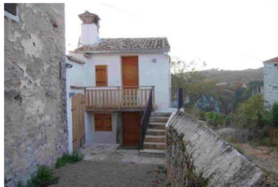
Kuća za pisce

Sanirana je rodna kuća Vladimira Gortana u Bermu (krovište je prekriveno škrljama, ugrađen novi limeni opšav oko dimnjaka, te zamijenjen dio poda u jednoj od prostorija kuće, uređen je i prostor oko spomenika i spomen kosturnice Vladimira Gortana u Podbermu. Na mjestu izvođenja prve oružane akcije podignuto je spomen obilježje, u skladu sa Idejnim i izvedbenim projektom).