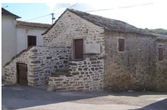
Rodna Kuća Vladimira Gortana u Bermu

Sanirana je rodna kuća Vladimira Gortana u Bermu (krovište je prekriveno škrljama, ugrađen novi limeni opšav oko dimnjaka, te zamijenjen dio poda u jednoj od prostorija kuće, uređen je i prostor oko spomenika i spomen kosturnice Vladimira Gortana u Podbermu. Na mjestu izvođenja prve oružane akcije podignuto je spomen obilježje, u skladu sa Idejnim i izvedbenim projektom).