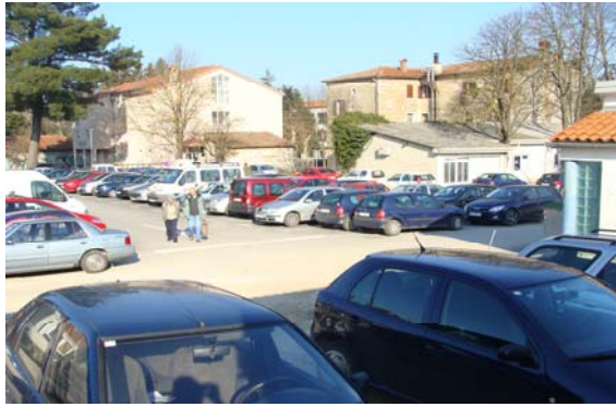
Parkiralište uz autobusnu stanicu