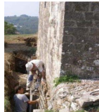
crkva sv. Petra i Pavla u Trvižu