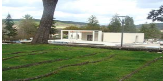
Kapelica, groblje Moj mir

2.2.8. dovršetak izgradnje memorijalnog centra - kapelice (mrtvačnica) uz mjesno groblje „Moj mir“ Pazin (okoliš nije dovršen - loše vrijeme); izradu dopune izvedbene projektne dokumentacije za proširenje i preuređenje dijela mjesnog groblja u naselju Kašćerga; izradu idejnog projekta za sanaciju potpornog-ogradnog zida mjesnog groblja u Zamasku; izradu idejnog rješenja za proširenje mjesnog groblja u Lindaru i izradu idejnog rješenja proširenja mjesnog groblja na Starom Pazinu.