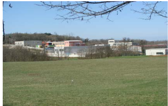
Industrijska zona Ciburi