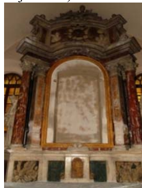
crkva Sv. Nikola u Pazinu