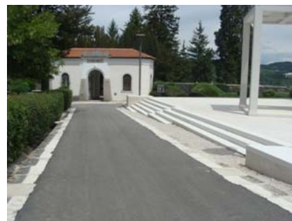
Mjesno groblje Moj mir