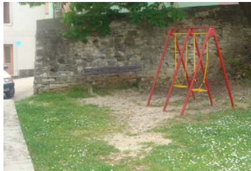
Klupa u ulici Eugena Kumičića

a) Uređenje javnih površina - u ulici Eugena Kumičića i ulici Prolaz Frana Matejčića uređene su klupe; u ulici Saše Šantela postavljen je dječji vrtuljak i klupa; zbog urušavanja uklonjena su stabla u Zagrebačkoj ulici; uređene (pokošene) su zelene površine u ulici Stancija Pataj – kod igrališta i oko prostora stočnog sajma, a prema potrebi vršeni su i manje složeni radovi zatvaranja i preusmjerenja prometa, čišćenja, osiguranja električne energije i sl.