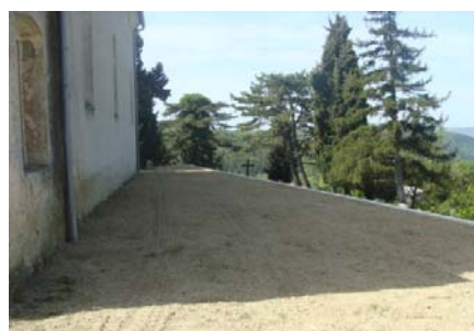
I. faza radova (betonskih i zemljanih) na mjesnom groblju Kašćerga