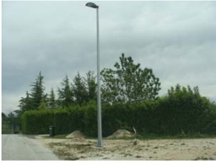
Javna rasvjeta Dvori