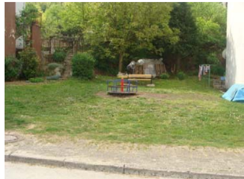
Klupa i vrtuljak u ulici Saše Šantela

b) Održavanje sustava odvodnje atmosferskih voda provodi se prema godišnjem programu ako dođe do začepljenja odvoda u slučaju jačih oborina provode se dodatne mjere zaštite.