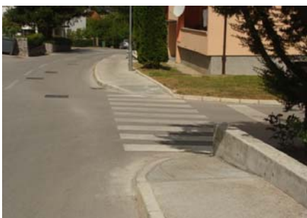
Prilazna rampa u ulici Dršćevka

- na javnim površinama u ulicama Dršćevka i Jurja Dobrile, na inicijativu Mjesnog odbora Pazin, izvršeno je uređenje osam (8) prilaznih rampi za osobe s invaliditetom.