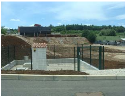
Fekalna odvodnja CS Ciburi