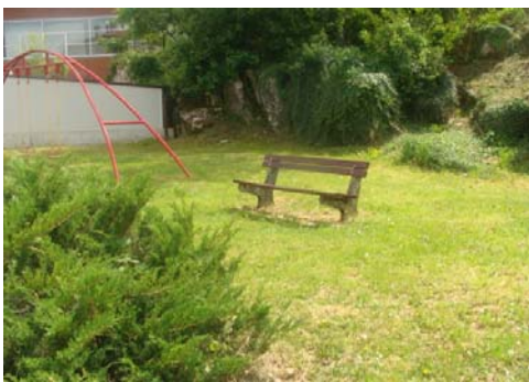
Klupa u ulici Prolaz Frana Matejčića