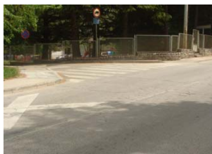
Prilazna rampa u ulici Jurja Dobrile

- započeta je priprema tehničke dokumentacije za uređenje kružnog toka „Štranjga“ u Pazinu; uređenje gradskog parka „Narodnog ustanka“; uređenje parkirališta u ul. V.C. Emina; uređenje spojne ceste u naselju Vranica, a naručen je idejni projekt rekonstrukcije kamenog opločenja u ulici 25. rujna.