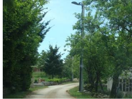
Javna rasvjeta Mala Traba