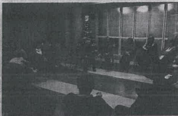
Stručni skup "Slobodno vrijeme kao rizični i zaštitni čimbenik"

Djedi i roditeljima potrebno je ponuditi lepezu aktivno-