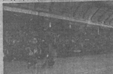
Popunjena tribina nove dvorane