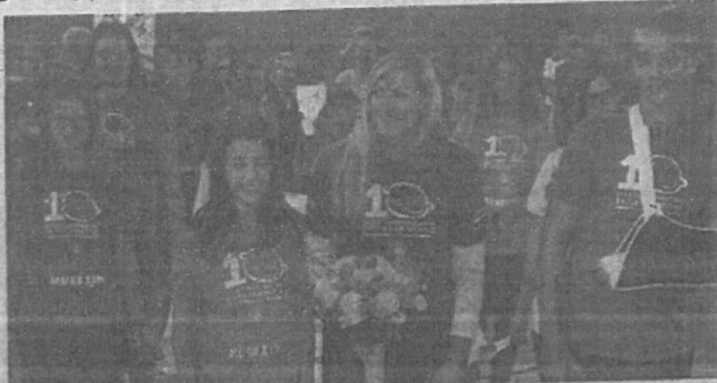
Olimpijadu je otvorila slavna sportašica Janica Kostelić

Kostelić je pozdravila sve mlade sportaše, uz poruku kako je sport nešto najljepše, nego u njemu uživaju, uz