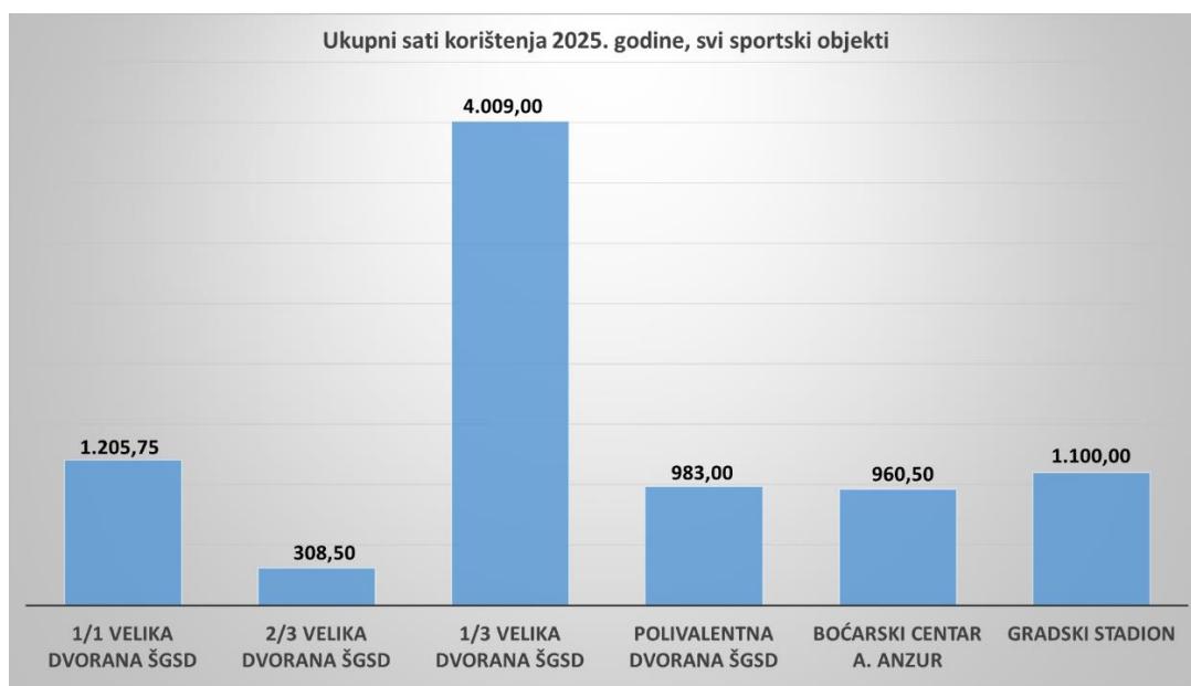
Grafikon 1. Ukupni sati korištenja sportskih objekata 2025. godine

Iz priloženog grafikona vidljivo je da se ŠGSD dvorana koristi najveći broj sati, dok se stadion s pomoćnim igralištem i boćarski centar koriste manji broj sati, što je neposredno vezano za ukupan broj sportaša udruga koje se bave ekipnim i pojedinačnim sportovima.